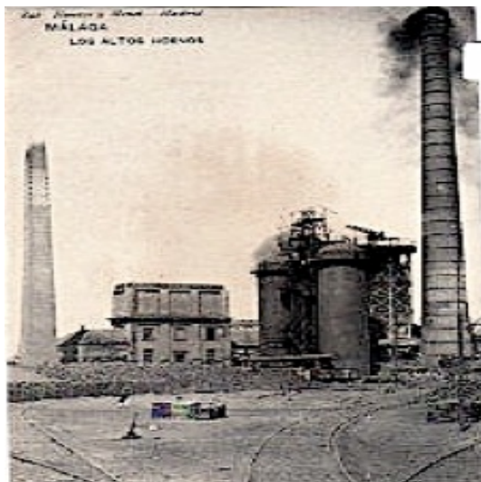
Fábrica de la Constancia. Altos Hornos de Málaga. 1847.

Relacione esta imagen con la revolución industrial en la España del siglo XIX.